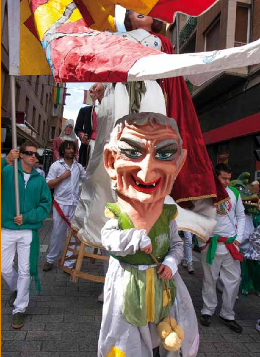
"Primera concentración de gigantes y cabezudos". Arnedo, septiembre de 2012

FIESTAS DE SAN JOSÉ ARNEDO del 15 al 17 de marzo de 2013