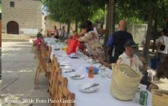
Agosto 2011.