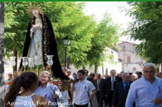
Agosto 2011.