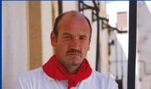
Vuestro Alcalde Claudio García Lasota