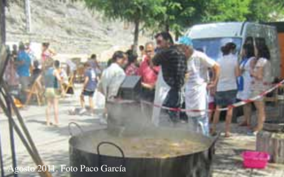
Agosto 2011.