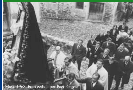
Mayo 1968.